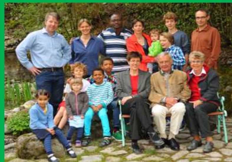
URBIS FOUNDATION: La famille fondatrice Epp