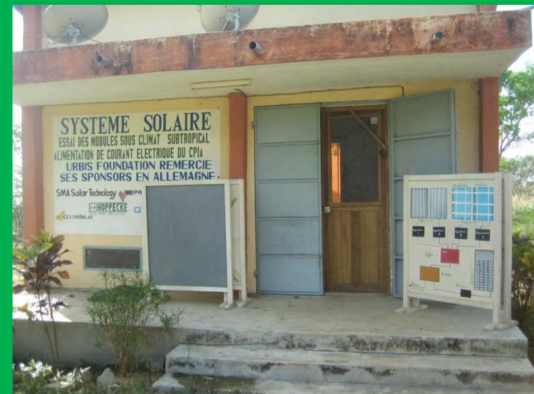
La maison de l'énergie solaire avec un tableau de la présentation