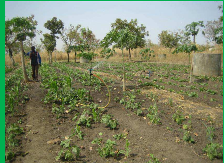
Culture de papayer et de tomates