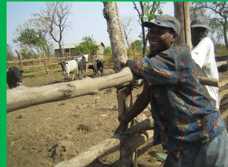
Bouvier avec bétails sur le pâturage de la ferme