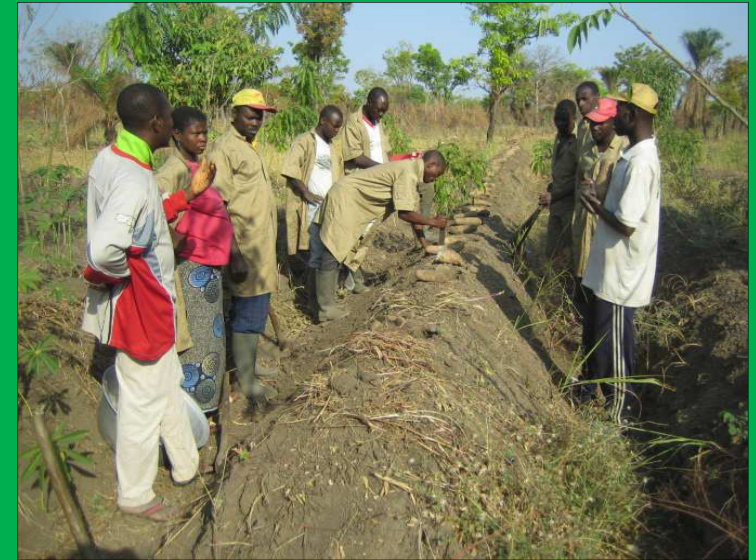
Direktor der Farm mit Jahrespraktikanten bei der technischen Prüfung im Yamsanbau