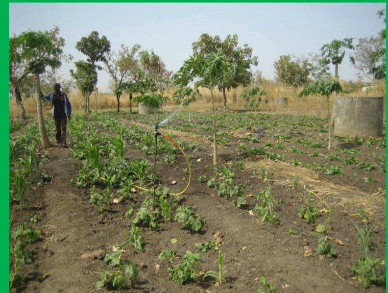
Kultivierung von Papayabäumen und Tomaten