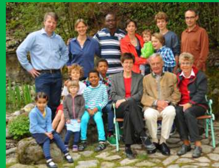
URBIS FOUNDATION: Stiftungsfamilie Epp