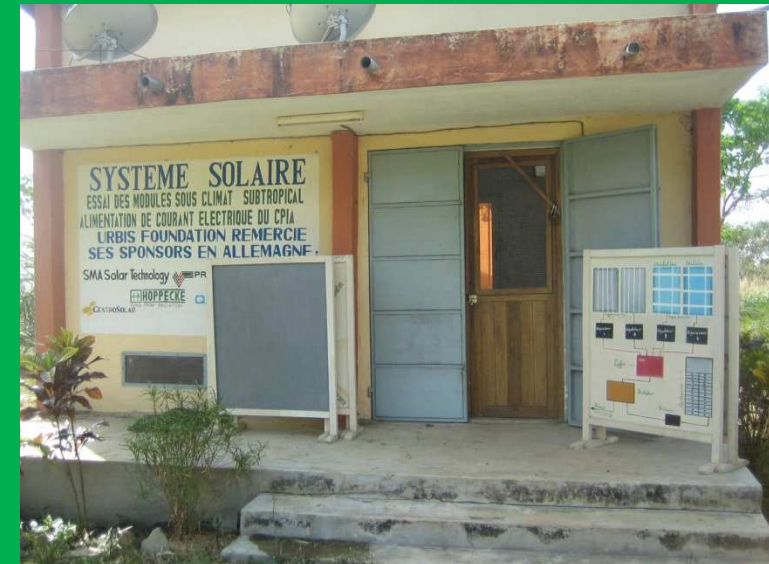
Solarhaus mit Präsentationstafel