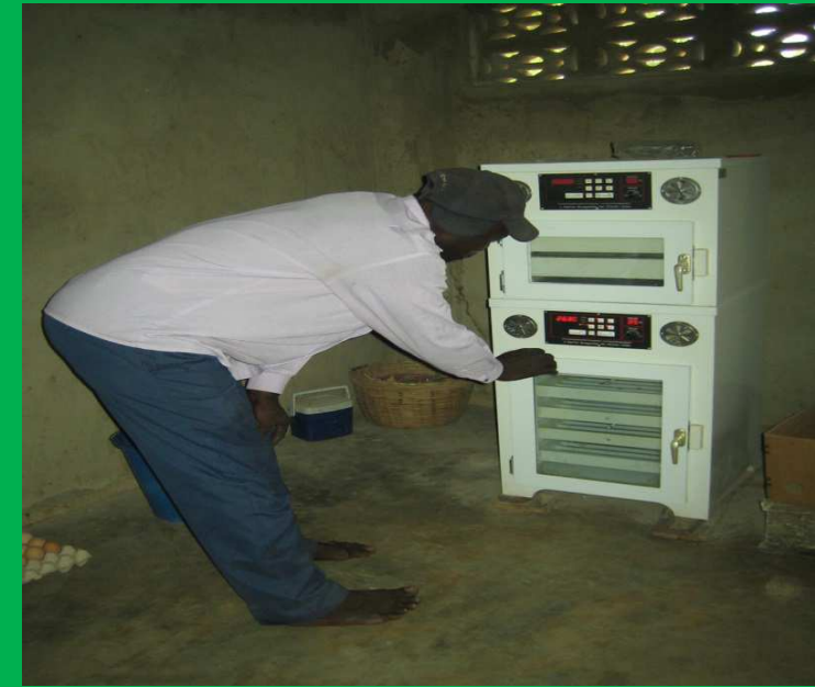
Kpowou (Verantwortlicher Viehzucht), Eierbrutanlage