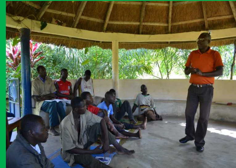
Unterricht für Jahrespraktikanten der Farm durch einen externen Experten